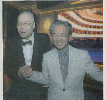
■全國政協委員、香港機場管理局主席及「港樂」副主席蘇澤光一向致力推動音樂發展，劉詩昆跟他分享宏揚高雅藝術的理念。