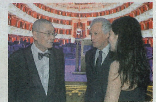
■法國前總理 Dominique de Villepin 跟兒子和女兒一起出席晚會，他表示女兒也是藝術家，特別欣賞劉詩昆對音樂和教育的遠大貢獻。