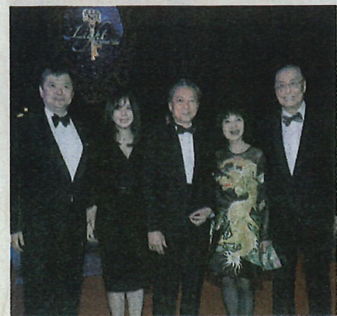
■日本前首相鳩山友紀夫伉儷（右二、右三）與劉詩昆是多年好友，這次他們特地來港出席愛心晚會，跟劉詩昆大兒子劉曉迎、孫女 Molli 談笑甚歡。

由國際鋼琴大師劉詩昆與鋼琴琵琶雙演奏家孫穎創辦的非牟利社會團體「中國全球音樂教育協會」早前於邵氏影城舉辦大型文化、公益、慈善晚會《照亮你生命·世紀音樂盛宴》，以「宏揚高雅藝術，熱心社會公益，發揚高尚愛心」為主題，喚起人們對貧困及殘障兒童教育問題的關注，提高他們接受音樂藝術教育的機會，建構和諧共融的社會。