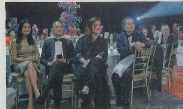
■「中國全球音樂教育協會」會長孫穎與著名時裝設計師 Vivienne Tam（左一）、時尚設計大師 Jimmy Choo（左二）、日本前首相鳩山友紀夫伉儷（右二、右三）、全國政協常委劉漢銓（右一）一起欣賞精彩的表演。