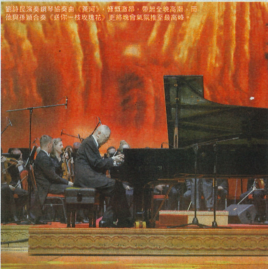
劉詩昆演奏鋼琴協奏曲《黃河》，慷慨激昂，帶起全晚高潮，而他與孫穎合奏《送你一枝玫瑰花》更將晚會氣氛推至最高峰。

多位國際級領袖、不同界別的精英翹楚包括法國前總理 Dominique de Villepin、日本前首相鳩山由紀夫、全國政協副主席韓啟德先生的夫人袁明教授、香港中聯辦副主任殷曉靜、中國外交部駐香港特派員公署特派員謝鋒、前律政司司長梁愛詩、諾貝爾物理學獎得主楊振寧、全國政協常委劉漢銓、華彬集團董事長嚴彬、金利豐行政總裁朱李月華、內地科技女首富周群飛、藝術大師韓美林、文學家余秋雨等都特地抽空出席這次愛心晚會，甚至不遠千里由外地來港支持。