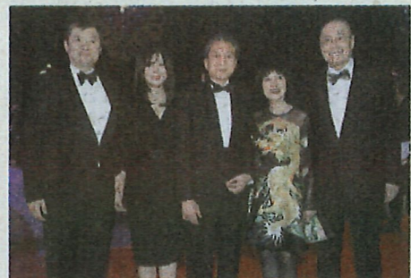
▲日本前首相鳩山由紀夫伉儷(右二、右三)與劉詩昆是多年好友，這次他們特地來港出席愛心晚會，跟劉詩昆大兒子劉曉迎、孫女 Molli 談笑甚歡。

由國際鋼琴大師劉詩昆與鋼琴琵琶雙演奏家孫穎創辦的非牟利社會團體「中國全球音樂教育協會」，早前於邵氏影城舉辦大型文化、公益、慈善晚會《照亮你生命·世紀音樂盛宴》，以「弘揚高雅藝術，熱心社會公益，發揚高尚愛心」為主題，喚起人們對貧困及殘障兒童教育問題的關注，提高他們接受音樂藝術教育的機會，建構和諧共融的社會。