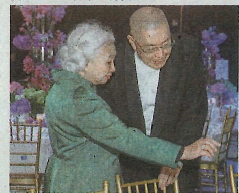
▲晚會當日，前律政司司長梁愛詩有要事在身，但也特地抽空到場一聚，跟劉詩昆分享對音樂和教育的熱誠。