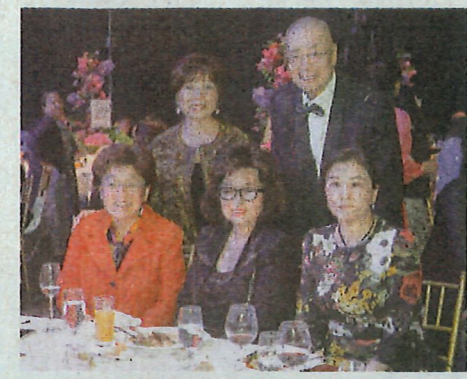
▲香港中聯辦副主任殷曉靜(前左)、長青歌后徐小鳳、中國科技女首富周群飛(前右)和金利豐行政總裁朱李月華(後左)喜相逢，共享音樂，傳揚愛心。