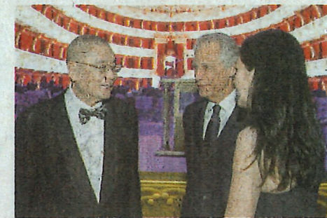
▲法國前總理 Dominique de Villepin 跟兒子和女兒一起出席晚會，他表示女兒也是藝術家，特別欣賞劉詩昆對音樂和教育的遠大貢獻。